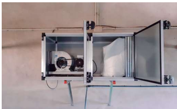
FIGURA 3. Scrubber seco.