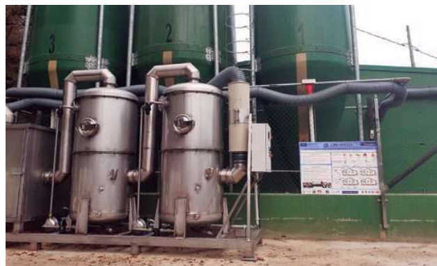
FIGURA 2. Scrubber húmedo.