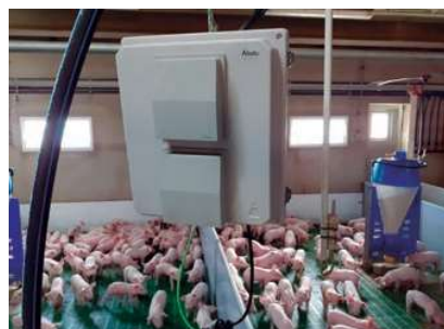
FIGURA 4. Equipo de medición de gases.