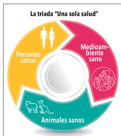
FIGURA 1. Anagrama de la estrategia "One Health".

Por lo tanto, existe una clara conexión entre parámetros que afectan tanto la salud y bienestar animal, como la salud humana y la ambiental, en línea con la estrategia "One Health-Una Sola Salud" (figura 1). Las nuevas tecnologías que se presentan a continuación tienen el objetivo común de mejorar la salud humana, ambiental y animal mediante la mejora de la calidad del aire en las granjas de porcino.